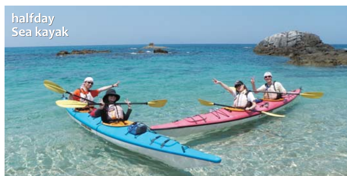
halfday Sea kayak