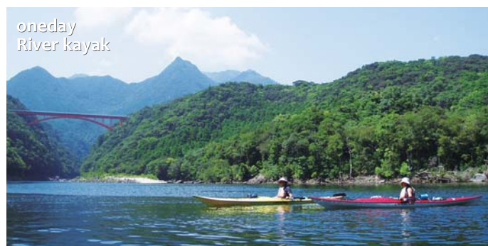
oneday River kayak