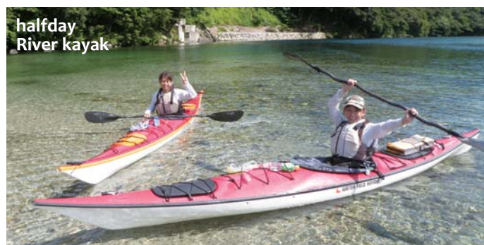
halfday River kayak