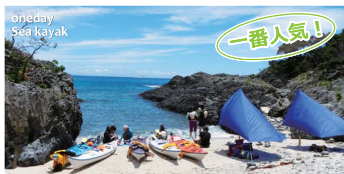
oneday Sea kayak

特に4月中旬から7月中旬までは産卵に帰ってくるアカウミガメも加わり、屋久島の海はまさにウミガメ天国です。暖かい時期にはウミガメに出会わない日のほうが少ないほどです。なお、当社のカヤックツアーは当日の最も条件の良いポイントを選び行きますので、初心者の方でも安心・安全です。